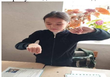
5-сүрөт. Билинчик көнүгүүсү.

Мында кадимкидей эле оң кол менен сүт машинаны айландыргандай айландырабыз, сол кол менен сүт куйгандай кылып солдон онду көздөй кол жаңсайбыз.