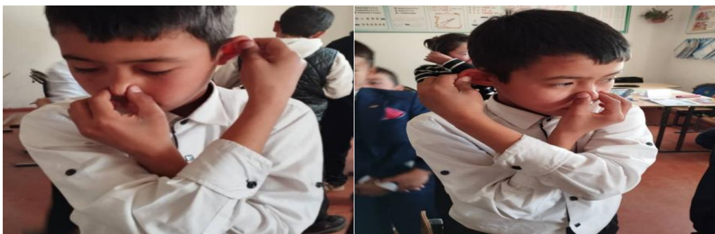
8-сүрөт. Жолдуу ыкмасы. Мында сол колдун манжаларынын баарыны ачабыз, оң колдо сөөмөй менен ортонду сунабыз.