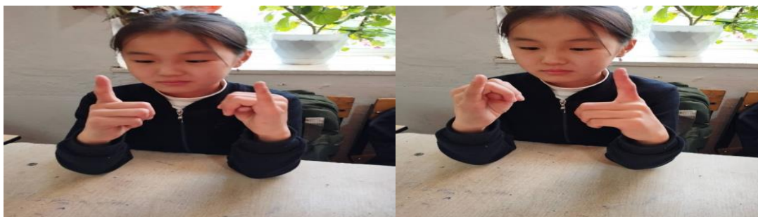
10-сүрөт. Көз, кулак көнүгүүсү.

Сол кол менен чыпалакты сунабыз, оң колдо сөөмөйдү сунабыз. Сөөмөй-чыпалак, чыпалак - сөөмөй. Бир колдо сөөмөй сунулганда экинчи колдо чыпалак сунулушу керек.