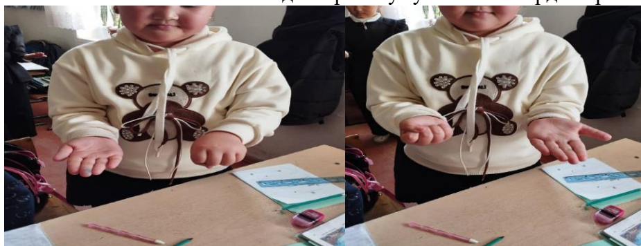
6-сүрөт. Сол колдун баш бармагы сөөмөй, ортон, аты жок, чыпалак болуп келсе оң колдун баш бармагы чыпалак, аты жок, ортон, сөөмөй болуп тескерисинен келет.

Оң колдун манжасыны ачабыз сол колдун манжасыны жумабыз. Ушул тартипте эки колдо жасайбыз. Ачылган кол асманды карап жумулган кол жерди карайт.