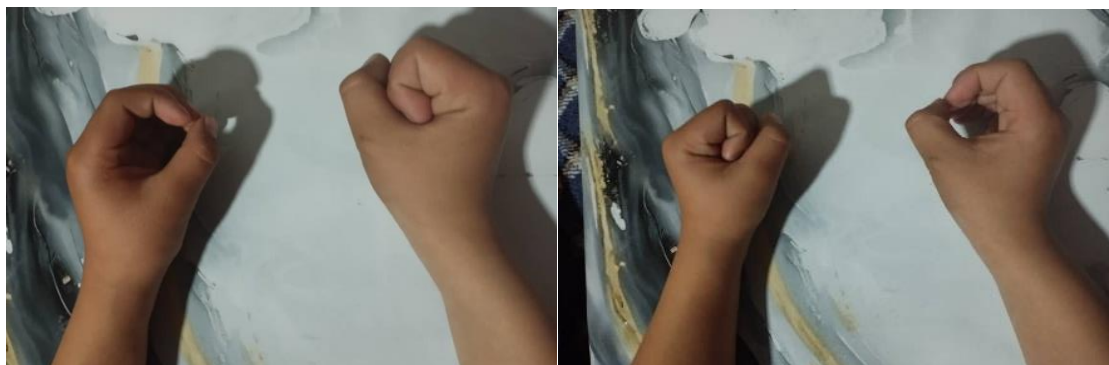
2-сүрөт. Оң кол менен башта коон тартабыз, сол кол менен карында айландыра дарбыздын сүрөтүн тартабыз.

1. Сол колдун эки манжасыны ачабыз (сөөмөй менен ортоң) оң колдун сөөмөйүн эки колдун үстүнө койбуз. Ушул эле көрүнүштү оң колдо жасайбыз.