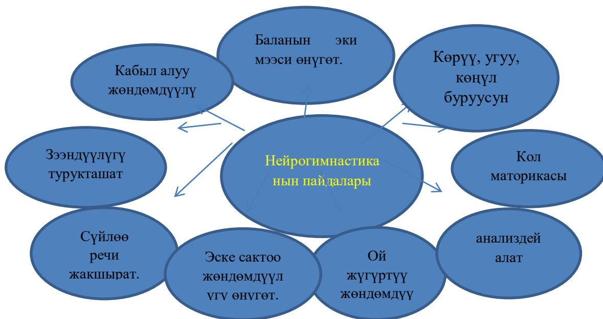
1-сүрөт. Нейрогимнастиканын түзүмдөрү.

Нейро - мээ, гимнастика- көнүгүү. Нейрогимнастика бул-мээге көнүгүү жасоо дегенди билдирет.