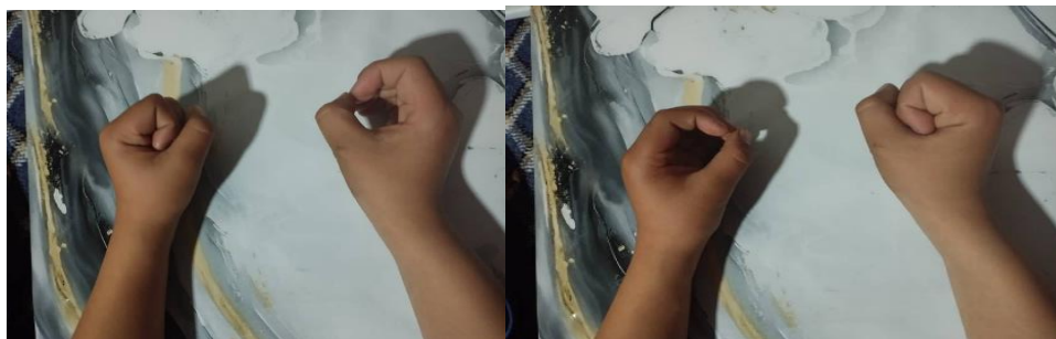
12-сүрөт. Атайын түстүү кагаздан тегерек жана төрт бурчтук, кесип алып тегерекке колубузду жумуп койсок, төрт бурчтукка жайып койбуз.