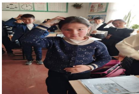
4-сүрөт. Сүт тартабыз.

Мында кадимкидей эле оң кол менен сүт машинаны айландыргандай айландырабыз, сол кол менен сүт куйгандай кылып солдон онду көздөй кол жаңсайбыз.