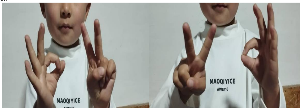
11-сүрөт. Калодос көнүгүүсү.

Бир колубузда көздү пайда кылсак экинчи колубузда кулакты пайда кылуубуз керек.